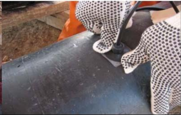
Foto 8: La sopapa se mantiene firme a la tubería durante 1 minuto.