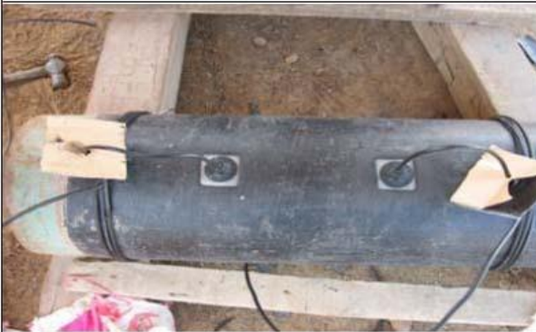
Foto 9: Vista superior de soldadura en frío Protabond. Resistencia entre extremos de cable 0.2 Ohm.